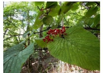
オオカメノキ(果実)