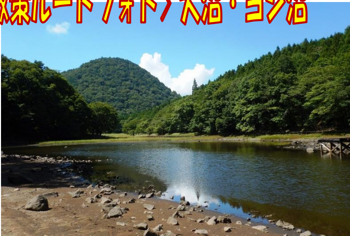
大沼からの新湯富士