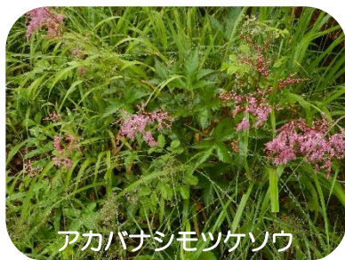
アカバナシモツケソウ