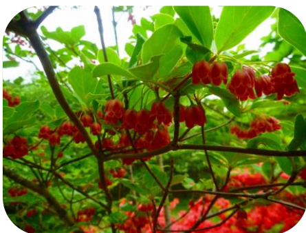
ベニサラサドウダン