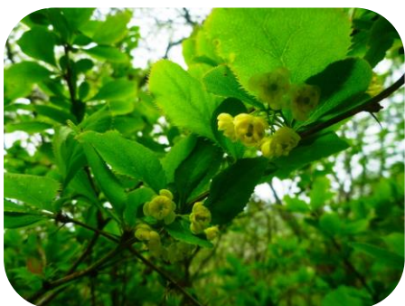
ヒロハヘビノボラス