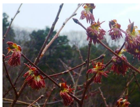
さらに拡大して観察