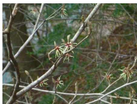
さらに拡大して観察