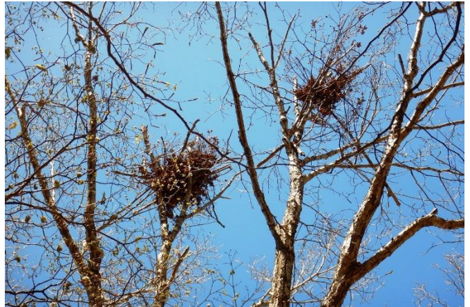
「熊棚」昨年の秋のものでしょう。ミズナラの巨木にありました。