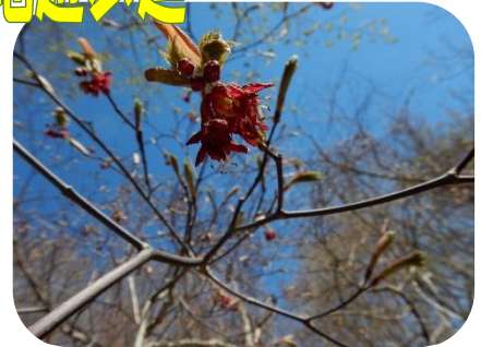
カエデ（ハウチワカエデ）