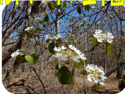
オオカメノキ（ムシカリ）