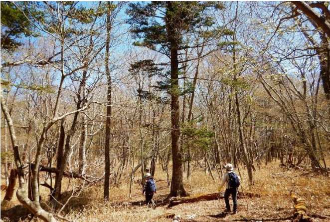
野鳥のさえずりが響き渡る土平園地遊歩道