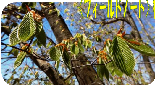
イヌブナの芽吹き