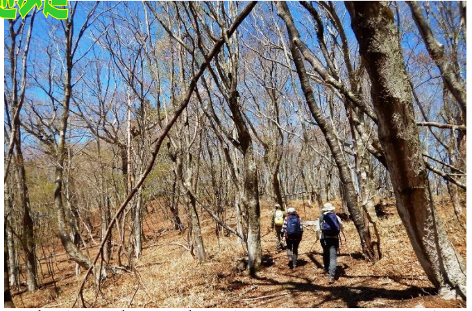
ブナやイヌブナ、ミズナラやオノオレカンパの巨木の森