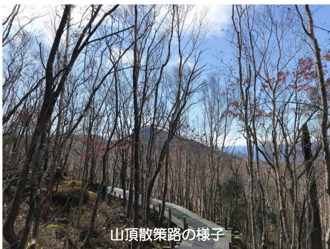
山頂散策路の様子