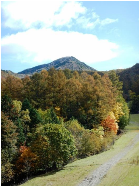
ゴンドラからの風景