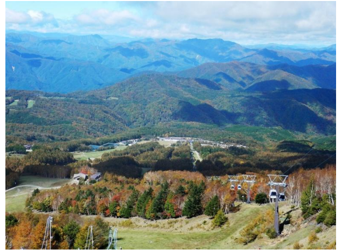
山頂から (WALL St)