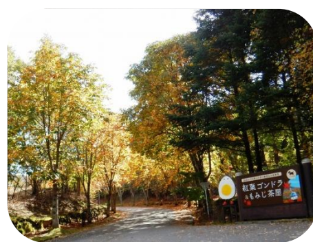
ハンターマウンテン入り口