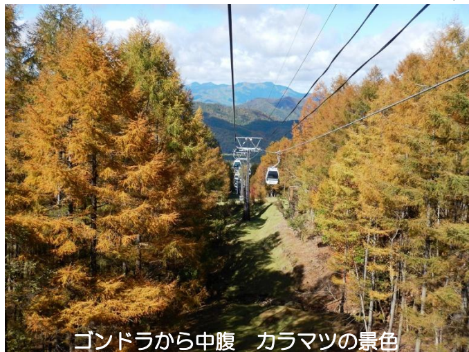
ゴンドラから中腹 カラマツの景色