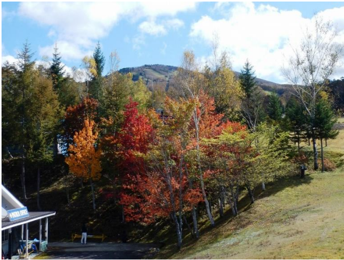
ゴンドラ乗車入り口から

森の紅葉絵巻は、日々その姿を変えていきます。塩原温泉郷での「紅葉狩り」の参考にしてください。