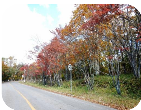
エーデルワイススキー場