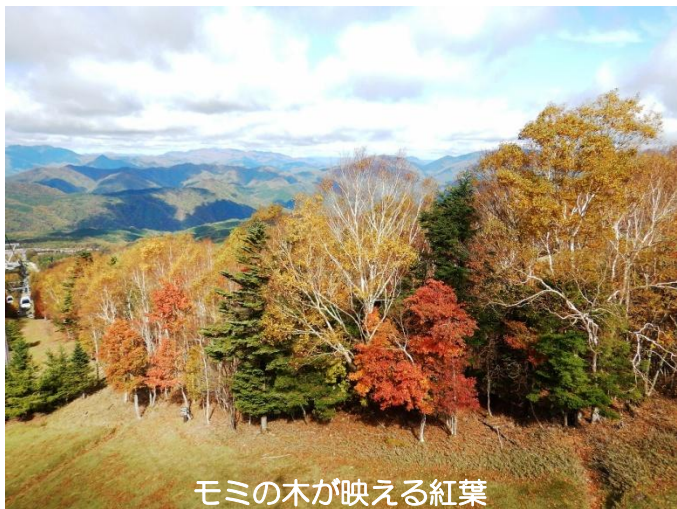
モミの木が映える紅葉