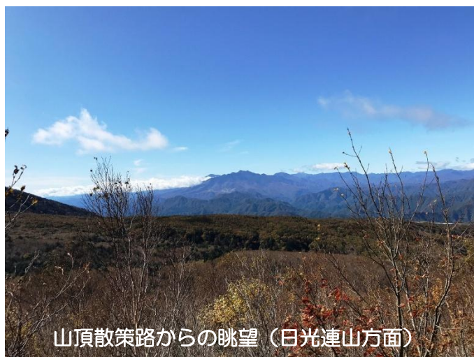
山頂散策路からの眺望（日光連山方面）