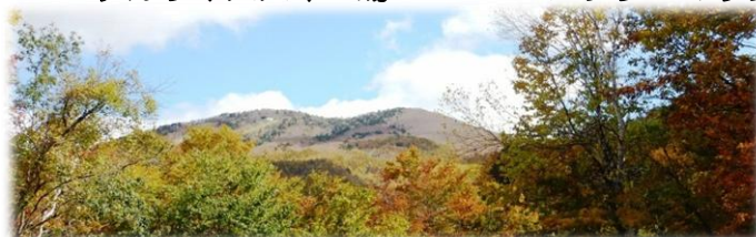
日塩もみじラインからのハンターマウンテン