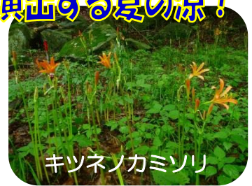
キツネノカミソリ