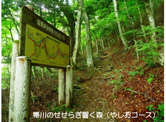
箒川のせせらぎ響く森(やしおコース)