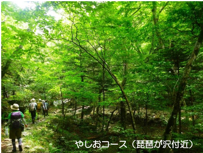
やしおコース(琵琶が沢付近)