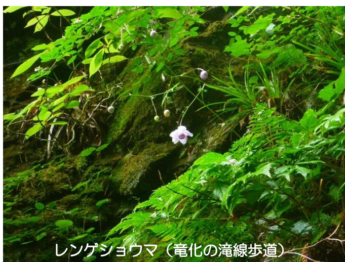
レンゲショウマ（竜化の滝線歩道）