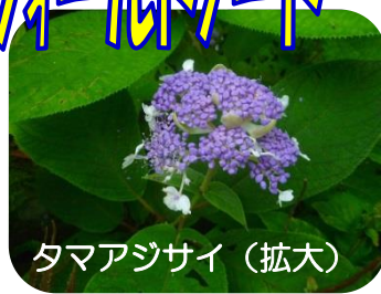
タマアジサイ(拡大)