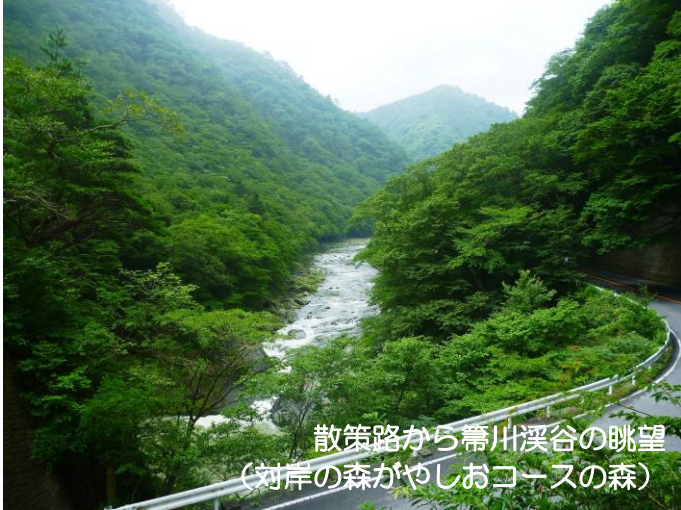
散策路から常川溪谷の眺望 (対岸の森がやしおコースの森)

塩原溪谷随一の名瀑を訪ねてください。溪谷全体でマイナスイオンを感じることができますよ！