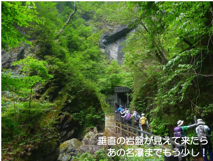
垂直の岩盤が見えて来たら あの名瀑までもう少し！