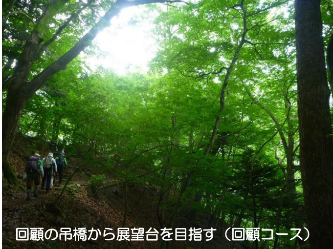
回顧の吊橋から展望台を目指す(回顧コース)

国道 400 号線と温泉郷を流れる箒川に沿って延びる遊歩道。さあ、夏の溪谷の森へ！