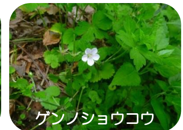
ゲンノショウコウ