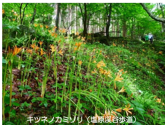
キツネノカミソリ（塩原溪谷歩道）