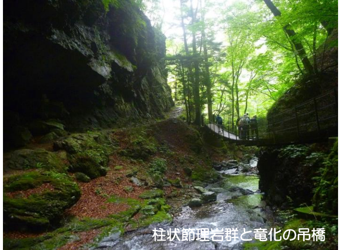
柱状節理岩群と竜化の吊橋