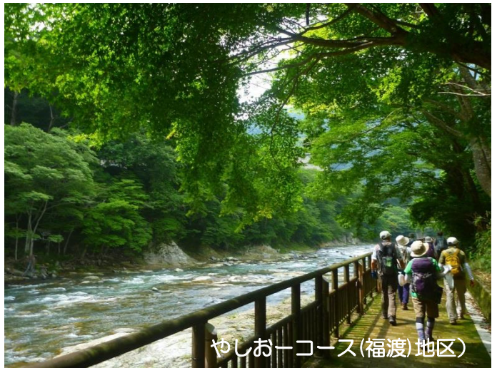
やしおコース(福渡)地区