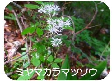
ミヤマカラマツノウ