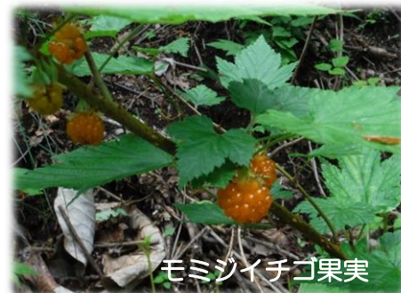
モミジイチゴ果実