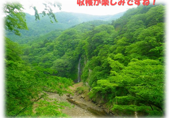
回顧の滝観曝台より