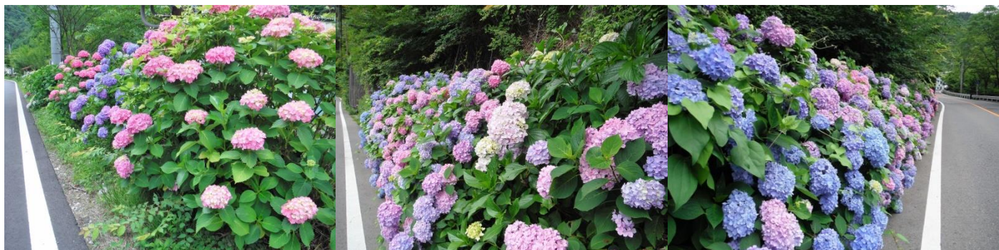
梅雨を楽しんで福渡地区アジサイ