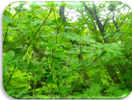
アフラツツジ(果実)