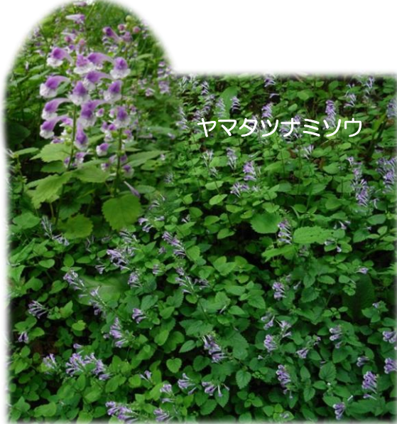
ヤマタツナミソウ

ヨシ沼では、ハッチョウトンボが観察できます。 マナーを守って静かに観察しましょう! (^_^)!